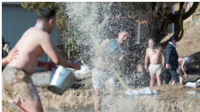
水かけ祭りのようす