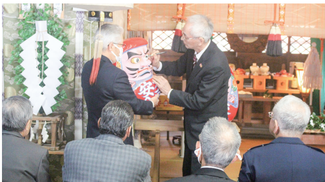
だるまに目入れする大内連合会長