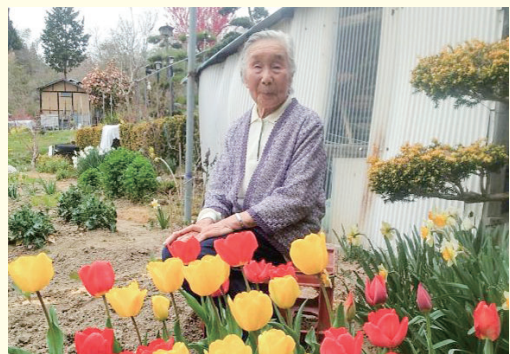
こころを込めて育てたチューリップと