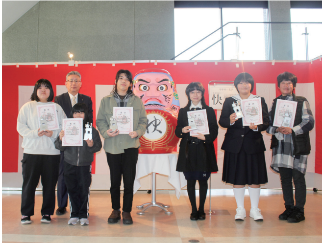
受賞された皆さんによる記念撮影