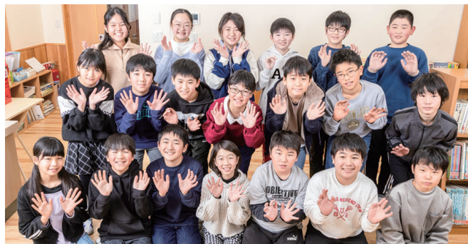
御木沢小学校 6年生の皆さん