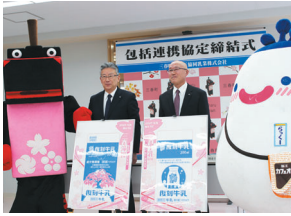
三春町・酪王協同乳業株式会社 包括連携協定締結式では、パッケージのお披露目も行われました。