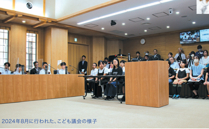
2024年8月に行われた、子ども議会の様子

4月からは三春町の小中学校の給食や健康サロンで配られたり、三春の里田園生活館などで販売をスタートします。三春駒（ばんとうプラザ内）でも三春牛乳プラントPRブースを設置し、各種イベントとあわせて、三春町外の人たちにもPR活動も行います。スーパーでの販売も予定していますので、三春町の皆さんぜひ楽しみにしてください。また、復刻版三春牛乳の売り上げの一部は滝桜の保全活動に使用されます。