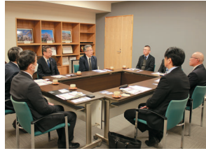
三春町、酪王協同乳業株式会社による懇談会の様子。

酪王牛乳の原点である三春牛乳。今回の復刻で、先人たちの努力と思いを若い世代に知ってもらいきっかけになればと強く思います。そして、復刻版牛乳をたくさん飲んで健康な体づくりを目指しましょう！