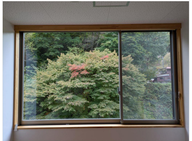
■ 10月28日(月) 撮影 議会資料室