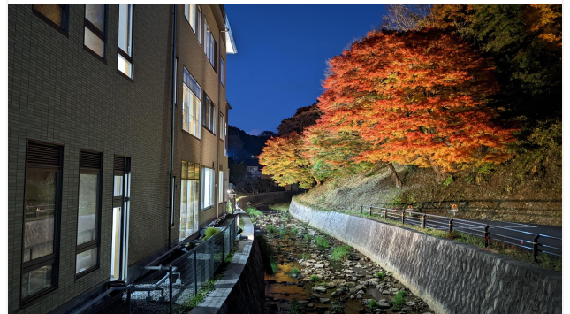
■ 昨年11月 撮影