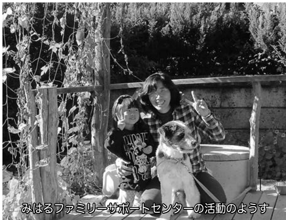
みはるファミリーサポートセンターの活動のようす