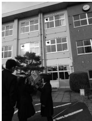
校舎時計の位置を測量する生徒