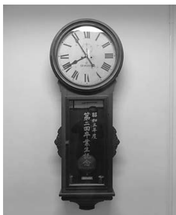
本校にある大きな古時計

この時計は、田中生・田高生をずっと見つめてきました。戦争中に飛行兵壮行会へ向かう生徒、高度経済成長期の学生運動に共感した生徒、そして東日本大震災後に様々な困難に立ち向かった生徒……。いろいろな時期の田中生・田高生の様子を想い浮かべつつ、時計を見ていただければと思います。