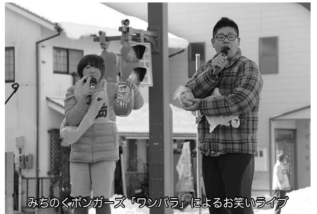
みちのくボンガーズ「ワンパラ」によるお笑いライブ