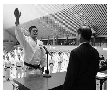
昨年の大会のようす

▼問 復興支援全国高等学校選抜柔道錬成三春大会実行委員会（三春交流館「まほら」内） ☎62・3837