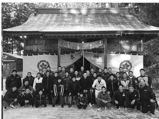
元旦参りを行った皆さん

部員や保護者、卒業生ら約150人が参加し、稽古の後には年始恒例となっている「必勝餅つき」を行いました。なお柔道部は3月20日・21日に東京・日本武道館で開催される全国高校柔道選手権大会に出場します。応援よろしく願います。