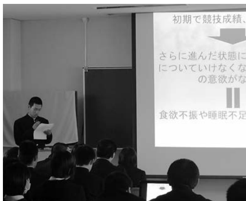
パワーポイントを使って発表する生徒

発表会には体育科1、2年生も参加し、発表に対する質疑応答も活発に行われました。一人ずつの発表形態のため、一人当たりの持ち時間が短いのが残念ですが、今後の競技力向上に資する大変有意義な時間を共有することができました。