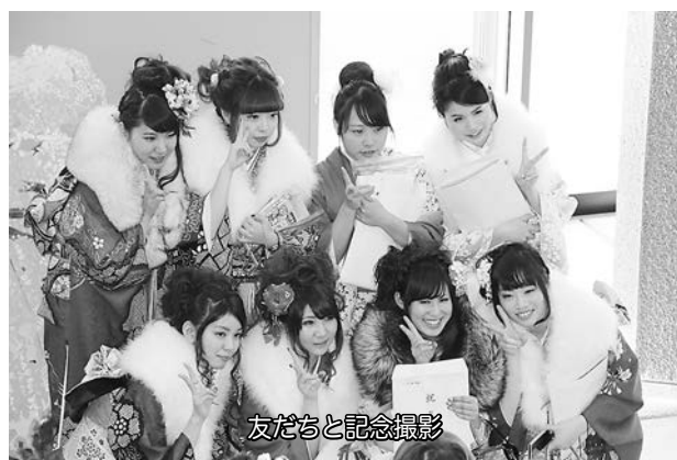
友だちと記念撮影