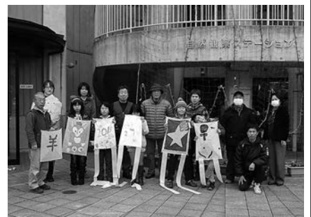
凧作り教室に参加した皆さん

参加者の皆さんは、講師や生涯学習支援ボランティアの皆さんの指導を受けながら、凧に自分の好きなイラストなどを描いて、それぞれオリジナルの凧を作り、新年の凧揚げを楽しみました。