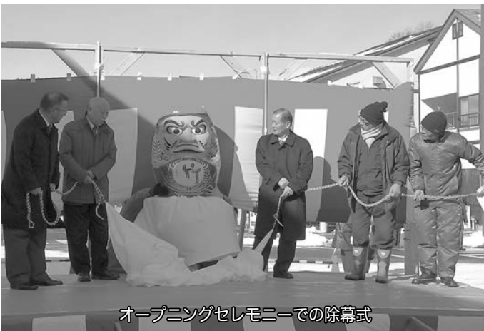
オープニングセレモニーでの除幕式