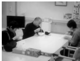
年越し蕎麦の振る舞い

大晦日の夜を病院で過ごされる患者さんのご家族や付き添いの方々に、温かいお蕎麦で年越しを迎えていただきたいとの願いを込めて、年越し蕎麦を振る舞いました。職員が心を込めて調理した温かいお蕎麦を提供し、ご好評いただきました。