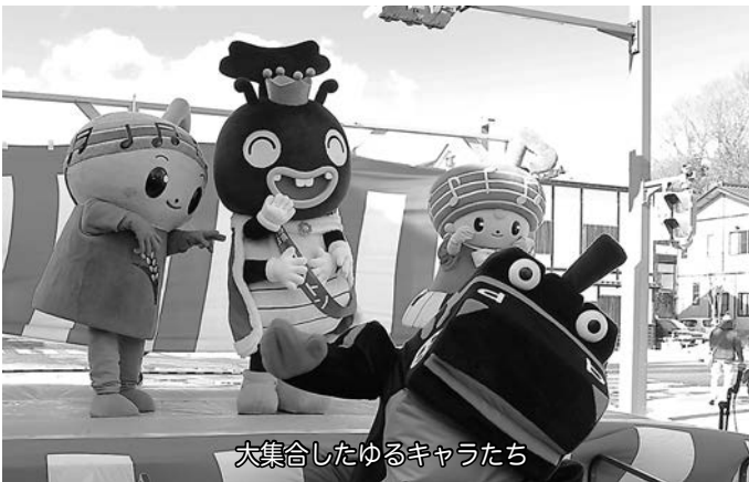
大集合したゆるキャラたち