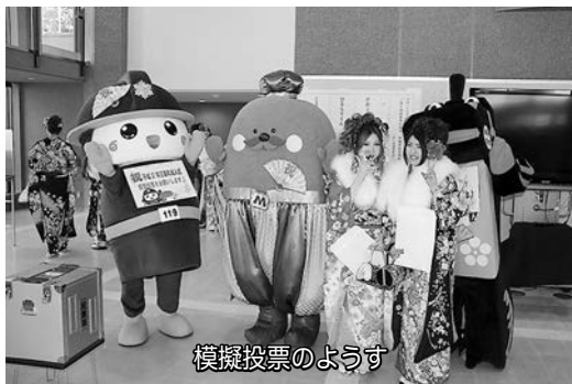
模擬投票のようす