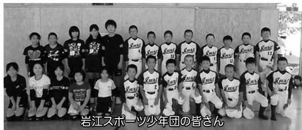
岩江スポーツ少年団の皆さん