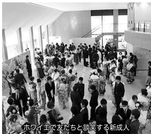
ホワイエで友だちと談笑する新成人