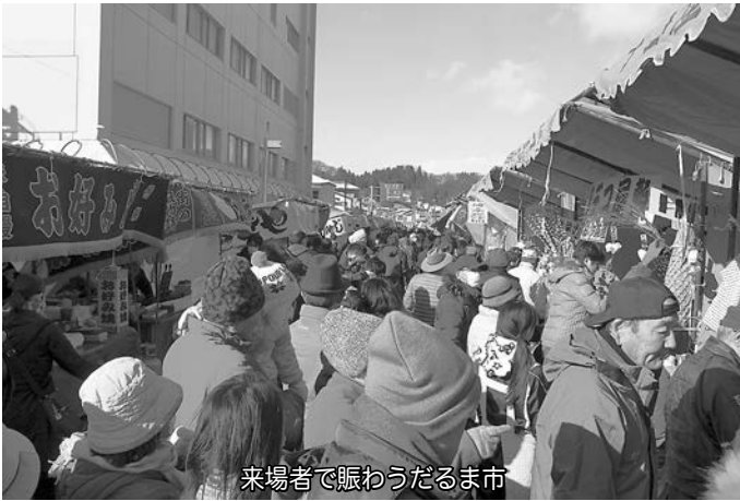
来場者で賑わうだるま市

また、大町太鼓保存会の皆さんによる三春太鼓の演奏や、高柴デコ屋敷の皆さんによるひよっとこ祝い踊りが披露されたほか、お笑いライブが行われるなど、縁起物を求めに来た多くの来場者で活気に溢れました。