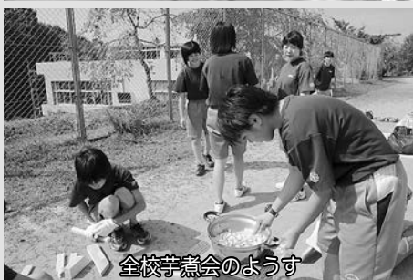
全校芋煮会のようす