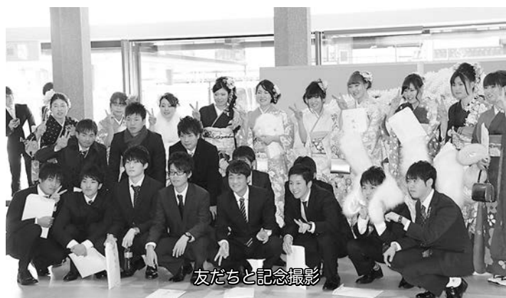
友だちと記念撮影