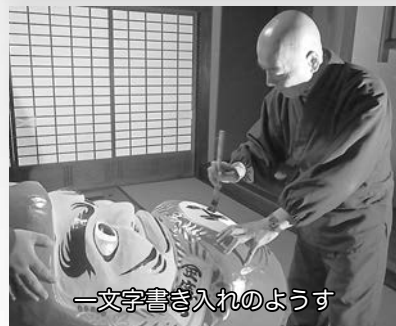
一文字書き入れのようす