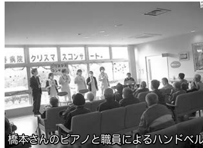
橋本さんのピアノと職員によるハンドベル