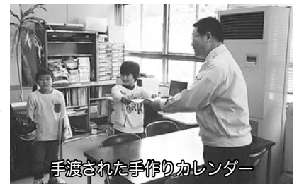
手渡された手作りカレンダー

昨年12月15日、三春小学校の特別支援学級「のびのび」の子どもたちが、手作りのカレンダーを届けてくれました。子どもたちは、「みんなで作りました。使って下さい。」と教育長に手渡しをしました。今は、教育委員会の部屋の中に飾ってあります。