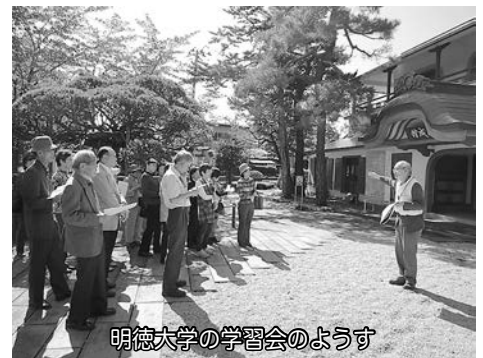
明德大学の学習会のようす