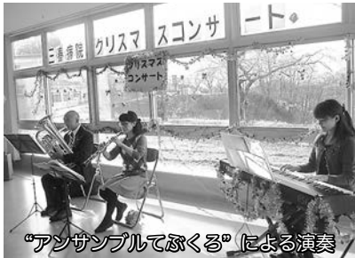
“アンサンブルてぶくろ”による演奏

職員で結成したグループ“アンサンブルてぶくろ”（ユーフォonium、オーボエ、ピアノ）も「そりすべり」や「きよしこの夜」「星に願いを」などのクリスマスソングを披露し、心温まるひとときとなりました。