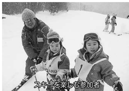
スキーを楽しむ参加者