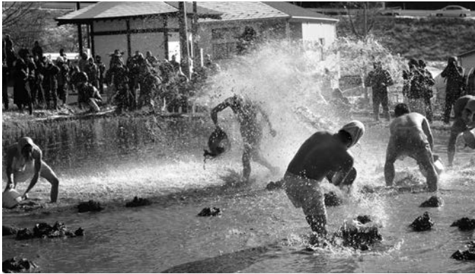
水や泥を掛け合う若者たち

水かけまつりは、地区の無病息災、五穀豊穣、子孫繁栄などに願いを込めて行われている町指定の無形民俗文化財です。