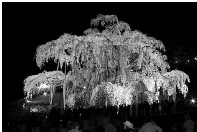
ライトアップされた滝桜