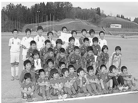
三春サッカースポーツ少年団の皆さん

その他、親子サッカー大会、合宿、クリスマス会などを開催して、団員、保護者、指導者との親睦にも力を入れていきます。随時団員募集をしていますので、ぜひ一度見学、体験に来てください。