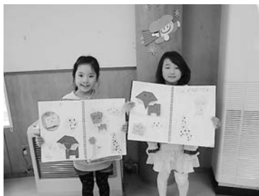
おりがみクラブのようす