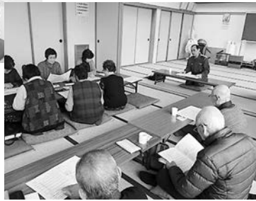
田村消防署三春分署の方から火災予防についてお話していただきました(下)