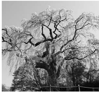
八十内かもん桜(桜ヶ丘)