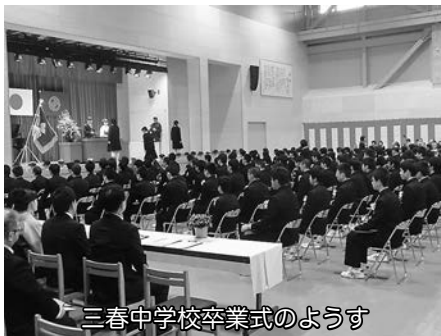
三春中学校卒業式のようす