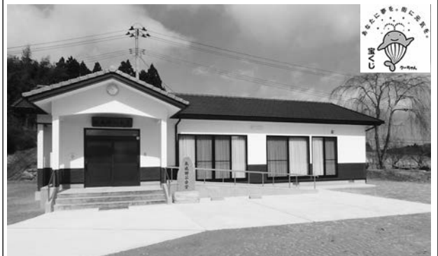
建設した北成田公会堂

新公会堂には駐車場も確保され、今後は地域住民の集会や緊急避難所としての利用はもちろんのこと、各種団体の活動にも利用されることとなり、コミュニティ活動がますます活性化することになります。