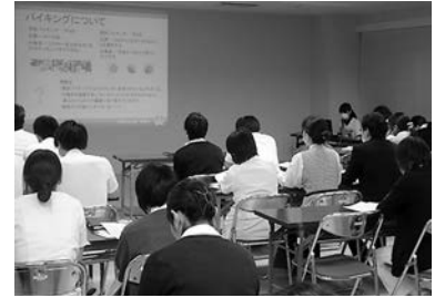
業務改善報告会ようす