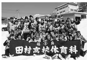
スキー実習のようす

また、3日目・4日目は雪が降ってフカフカの雪の上を滑るといふ貴重な経験をすることができました。全員がしっかりと実習を取り組み、スキー検定をみんなで合格することができてよかったです。また宿舎（故郷さん）でも食事や勉強など、普段とは違う団体行動を意識した生活をすることができました。今回のスキー実習を通して、スキーの技術や体育の仲を深めることができ、思い出に残る楽しいスキー実習になりました。