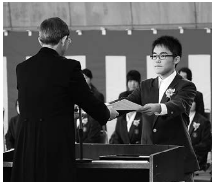
卒業証書授与のようす