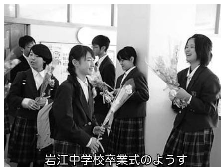
岩江中学校卒業式のようす