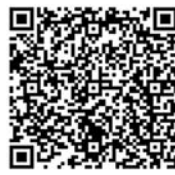
携帯サイトQRコード