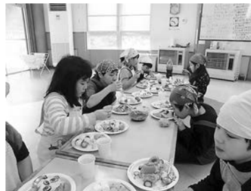
料理クラブのようす