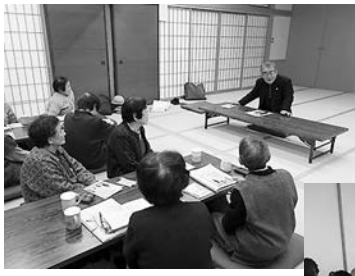
人権擁護委員の方から「なりすまし詐欺」のお話していただきました(上)

また、各地区でも歩行機能向上や認知症予防効果があるスクウェアステップ運動などを実施しています。にこにこ元氣塾の申込みはお電話でも受付可能です。見学も随時おこなっておりますので、ぜひ、お越しください。