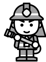
全国消防イメージ キャラクター 消太

高齢者世帯に対する助成制度があります。 詳しくは、役場総務課自治防災グループ (Tel62-1114) にお問い合わせください。