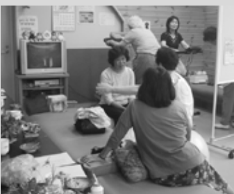
サロンを利用するみなさん