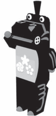
三春町マスコットキャラクター「こまりん」