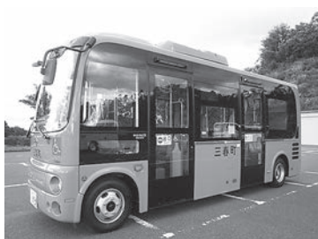
イベント運行される町営バス

10月1日から4日までの4日間、全便無料運行を実施します。詳細は、先月配布した時刻表、チラシをご覧ください。ぜひ、この機会に町営バスを利用ください。