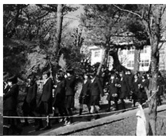
避難のようす(上) 集合のようす(左)

◆ 今回は、訓練日程を変更したために、郡山地方広域消防組合田村消防署三春分署から講師の方は来られませんでした。直前に大きな地震があり、生徒たちは真剣に避難訓練に取り組んでいました。