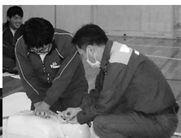
心臓マッサージのようす(上) 人工呼吸のようす(左)