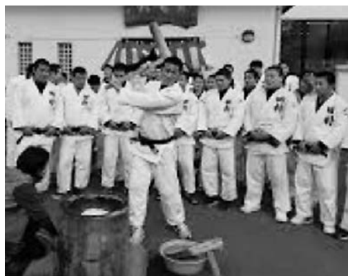
必勝餅つきを行う柔道部の皆さん

◆ 必勝餅つきを行う柔道部の皆さん なお柔道部は3月19・20日に東京・日本武道館で開催される全国高校柔道選手権大会に出場しますので応援をよろしく願います。