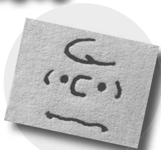
『スヌーピーとチャールズ・M・シュルツの芸術 必要なものを』チップ・キッド/著 奥田祐士/訳 DU BOOKS

科学絵本の傑作『かわ』は、川の流れる楽しく描き、刊行以来50年以上の間読み継がれてきました。「絵巻じたてひろがるえほん」は、『かわ』の全てのページをつなげ、7メートルの長い絵巻に仕立てられており、源流から海までの流れが一望できます。川と人との営みが感じられる、壮大な旅を楽しんでみてください。