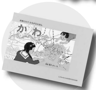
『かわ 絵巻じたてひろがるえほん』 加古里子/さく・え 福音館書店

科学絵本の傑作『かわ』は、川の流れる楽しく描き、刊行以来50年以上の間読み継がれてきました。「絵巻じたてひろがるえほん」は、『かわ』の全てのページをつなげ、7メートルの長い絵巻に仕立てられており、源流から海までの流れが一望できます。川と人との営みが感じられる、壮大な旅を楽しんでみてください。